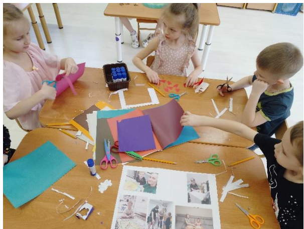
Рисунки «Играем всей семьей»