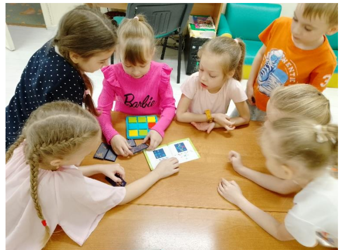
«Мастер – класс родителей для детей»